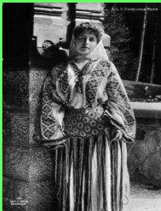
REGINA MARIA A ROMÂNIEI