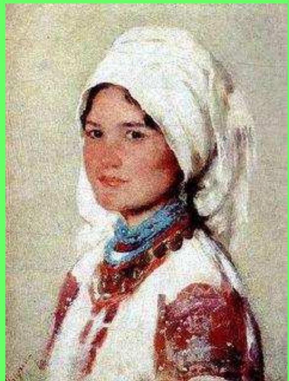
Ie românească (pictură)

Să ai viață de vecie, Să sporească-al tău popor; Sub stindardul tricolor Să nu vezi decât frăție, Și-atunci, dac-o fi să fie, Pot să mor!